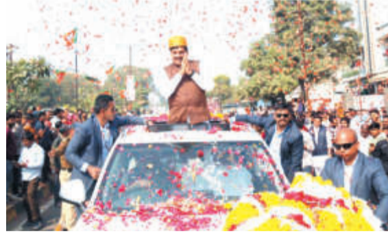
यहां पहुंचने पर पुष्पवर्षा कर लोगों ने उनका स्वागत किया।

सीएम यादव तीन दिवसीय 25वीं रतलाम अंतरविद्यालयीन प्रतियोगिता का शुभारंभ करेंगे। इसके साथ ही क्षेत्र को कई सौगंठों भी देंगे। इसमें मुख्य अतिथि मुख्यमंत्री डॉ. यादव नेहरू स्टेडियम में आयोजित होने वाले समारोह के दौरान मार्च पास्ट की सलामी लेंगे और विधिवत रूप से खेल चेतना मेला का शुभारंभ करेंगे। खेलों के इस महाकुंभ के 18 खेलों में 10000 से अधिक