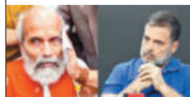
विपक्ष के विरोध प्रदर्शन के दौरान धक्का-मुक्की हुई। इसमें भाजपा के दो सांसदों ने राहुल गांधी पर धक्का देने के आरोप लगाए। कांग्रेस ने भी कुछ ऐसे ही आरोप लगाए। दोनों ने ही दिल्ली पुलिस के पास एफ आई आर दर्ज कराई। अब

राज्य सभा में केन्द्रीय गृहमंत्री अमित शाह के बाबा साहेब पर बयान के बाद संसद में सत्ता पक्ष और