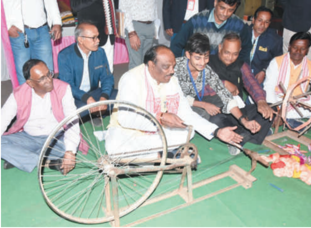
भोपाल। हॉट बाजार में टाइफाइड द्वारा आयोजित आदिवासी उद्यमिता संस्कृति एवं व्यवसाय की स्थापना के लिए आयोजित किए गए आदि महोत्सव मेले का शुभारंभ केंद्रीय राज्य मंत्री दुर्गादास उडके ने किया। इस अवसर पर केंद्रीय मंत्री ने आदिवासी रंग में रंग कर बोल बजाया, कपड़े की बुनाई करी एवं दुकानों में पहुंचकर सामान का अवलोकन किया।

भोपाल। भोपाल स्टेशन परिसर में आँटों वाली की गुंडागर्दी, बिना पर्ची के इटीगेटेड पार्किंग में घुस रहे हैं। पार्किंग कर्मचारी उन्हें टोकते हैं तो यह हथपाई करने पर उतारू हो जाते हैं। इटीगेटेड पार्किंग का बैरियर निकल जाते हैं। इसका खमियाजा आए और पीछे खड़े दोपहिया और चार ?पहिया वाहन चालकों को भुगतान पड़ता है। प्लेटफार्म एक की नई बिल्डिंग के बाहर इनके जमावड़े से यात्रियों को प्लेटफार्म में आने-जाने में भी परेशानी होती है। उधर, 6 नंबर प्लेटफार्म की ओर बने बोमी रेस्टोरेंट को प्लेटफार्म में, एक की ओर पुरानी बिल्डिंग के सामने शिफ्ट किया जाना प्रस्तावित है। लेकिन आँटों वाली ने अपना यहां अयोधित स्टैंड बना रखा है। जीआरपी थाना के सामने दोपहिया वाहन पार्किंग में भी आँटों वाली का अवैध कब्जा है।