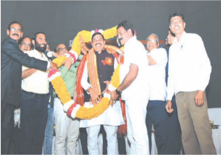
भोपाल | बरकतउल्लाह यूनिवर्सिटी के ज्ञान विज्ञान भवन में शुक्रवार को विभिन्न यूनिवर्सिटी के कर्मचारी संघ के द्वारा मुख्यमंत्री डॉ मोहन यादव का बड़े हार से स्वागत किया।