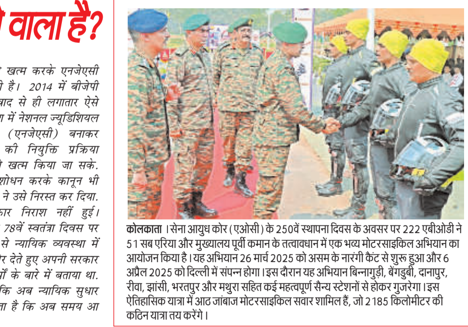
कोलकाता। सेना आयुध कोर (एओसी) के 250वें स्थापना दिवस के अवसर पर 222 एबीओडी ने 51 सब एरिया और मुख्यालय पूर्वी कमान के तलावधान में एक भव्य मोटरसाइकिल अभियान का आयोजन किया है। यह अभियान 26 मार्च 2025 को असम के नार्गी कैट से शुरू हुआ और 6 अप्रैल 2025 को दिल्ली में संपन्न होगा। इस दौरान यह अभियान बिनानाडू, बैंगलूर, दानपुर, रीवा, झांसी, भरतपुर और मथुरा सहित कई महत्वपूर्ण स्थानों से होकर गुजरगा। इस ऐतिहासिक यात्रा में आठ जाबाज मोटरसाइकिल सवार शामिल हैं, जो 2185 किलोमीटर की कठिन यात्रा तक करेंगे।

कॉलेजियम सिस्टम को खत्म करके एनजेपी को लाना कितना जरूरी है। 2014 में बीजेपी को सरकार बनने के बाद से ही लगातार ऐसे प्रयास होते रहे हैं कि देश में नेशनल ज्यूडिशियल अपॉइंटमेंट्स कमीशन (एनजेपी) बनाकर न्यायालयों में जजों की नियुक्ति प्रक्रिया कॉलेजियम सिस्टम को खत्म किया जा सके। सरकार ने संविधान संशोधन करके कानून भी बनाया पर न्यायपालिका ने उसे निरस्त कर दिया, इसके बाद भी सरकार निराशा नहीं हुई। प्रधानमंत्री नरेन्द्र मोदी ने 78वें स्वतंत्र दिवस पर लागू किये के प्राचौर से न्यायिक व्यवस्था में सुधार को जरूरत पर जोर देते हुए अपनी सरकार में रिफॉर्मस पर हुए कार्यों के बारे में बताया था। मोदी ने तब कहा था कि अब न्यायिक सुधार समय की मांग है, लगता है कि अब समय आ गया है। उपरोक्त दोनों फैक्ट बताते हैं कि देश में